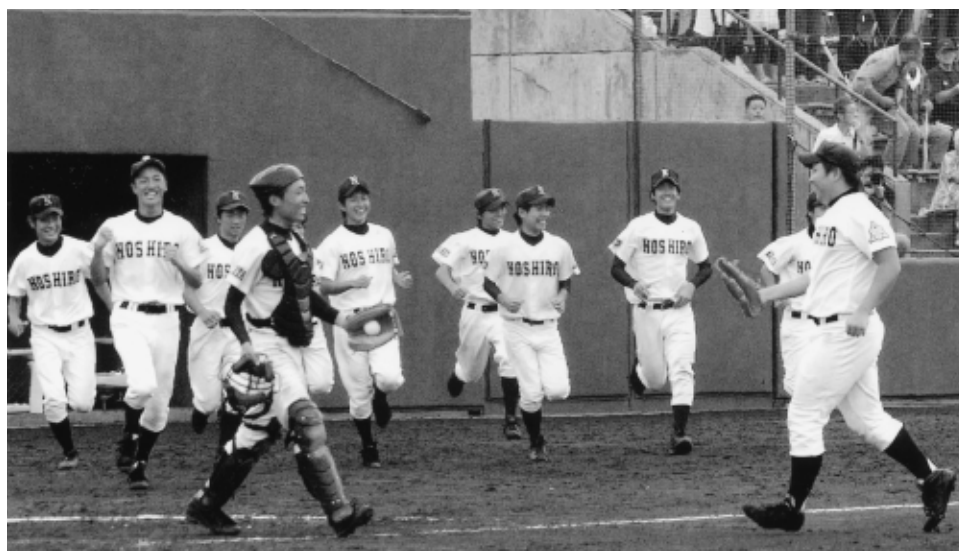
【弘前工一能代】14年ぶり13度目の優勝を決め、ホームベース付近に駆け寄る能代の選手ら＝能代球場