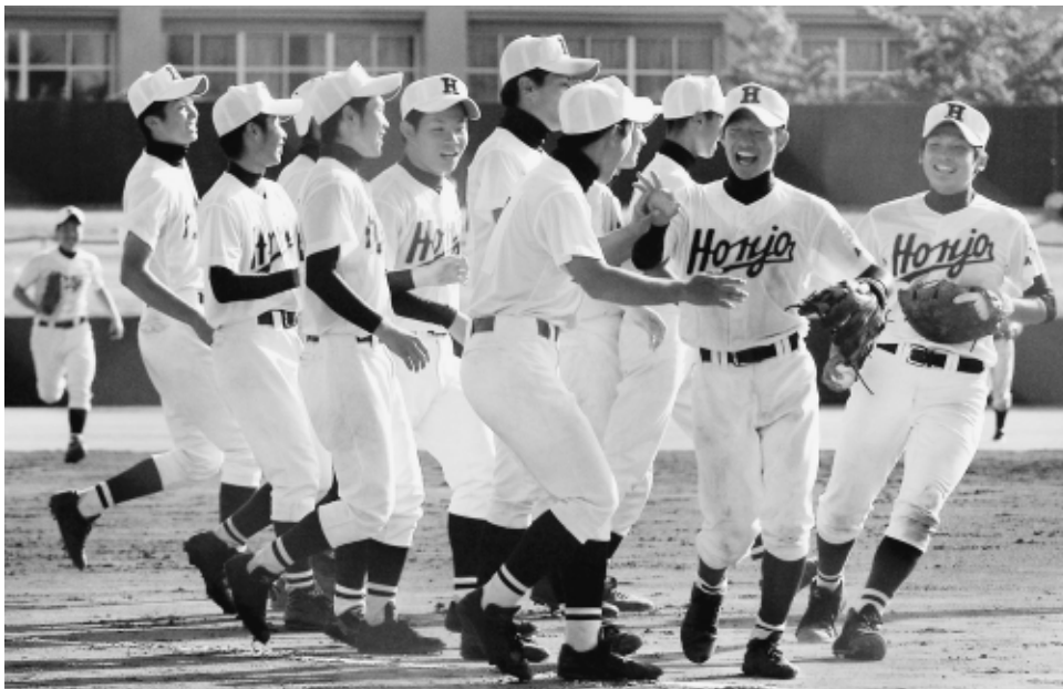
【本庄一金足農】 逆転勝利で32年ぶりの優勝を決め、喜び合う本庄ナイン＝能代球場