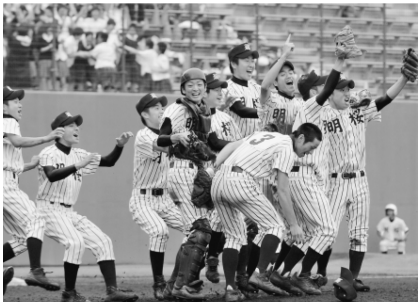
本荘を下して優勝を決め、マウンドに集まって喜ぶ明桜の選手たち