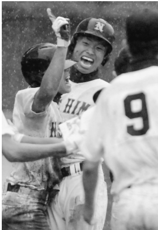
(秋田さきがけ 7月19日付)