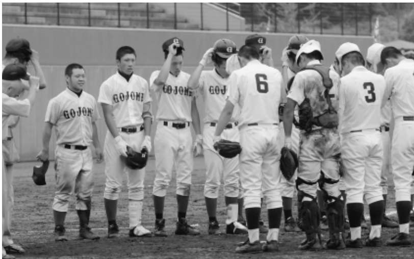
【大館鳳鳴—五城目】 延長15回の激闘の末に引き分け、 整列する両チームのナイン=グリーンスタジアムよこて

※この試合は、延長15回引分けとなったため、試合規程により7月14日(火)に再試合となりました。